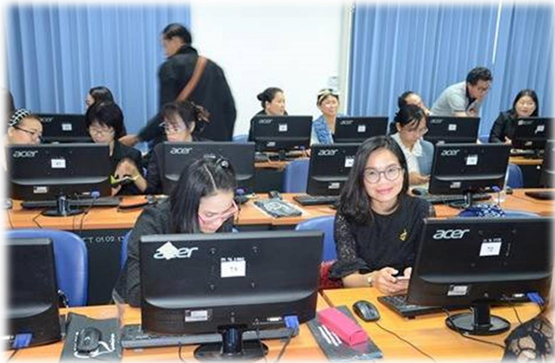
การวิเคราะห์สรุปผลการทดลองใช้เครื่องมือ สื่อ กิจกรรมการเรียนรู้และจัดทำรายงานสอดคล้องกับการศึกษา