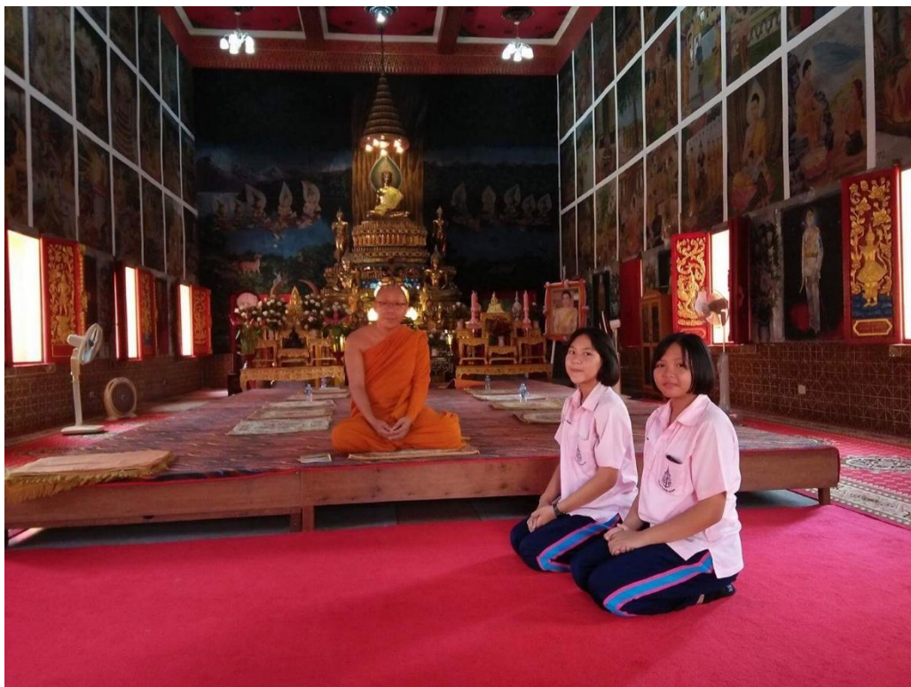
การจัดกิจกรรมการเรียนรู้แบบศึกษานอกห้อง