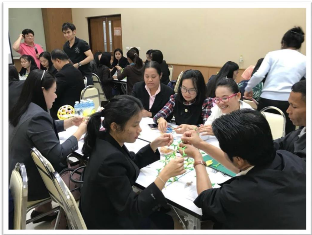
STEM Education ระดับมัธยมศึกษา มหาวิทยาลัยมหิดล