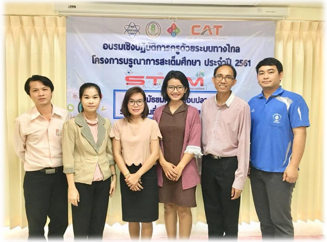
การพัฒนาครูสะเต็มด้วยระบบทางไกล โครงการบูรณาการสะเต็มศึกษา