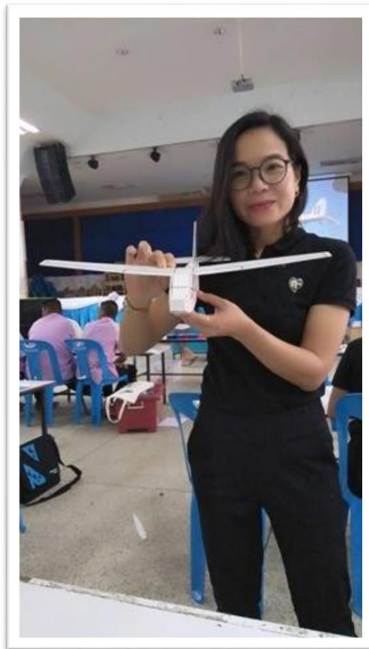
อบรมเชิงปฏิบัติการวิทยาศาสตร์อากาศยาน ประเภทเครื่องบิน