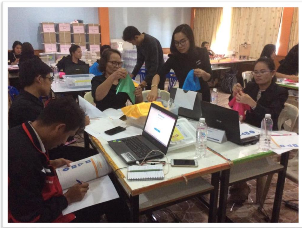
การพัฒนาครูสะเต็มด้วยระบบทางไกล โครงการบูรณาการสะเต็มศึกษา